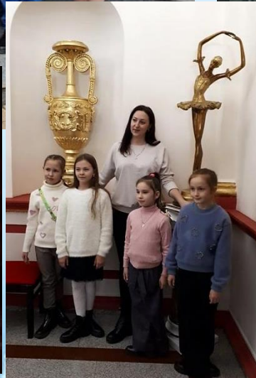
Просмотр мюзикла «Тайна сказочного королевства», филармония им. Г.Ф.Пономаренко, г.Краснодар