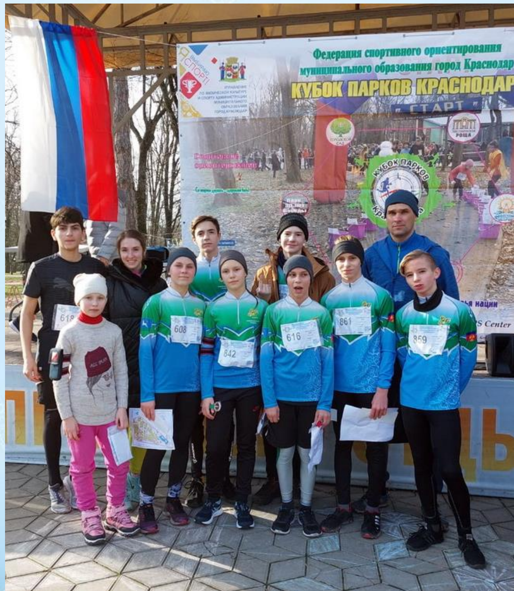
Участие во II этапе кубка Парков города Краснодара по спортивному ориентированию